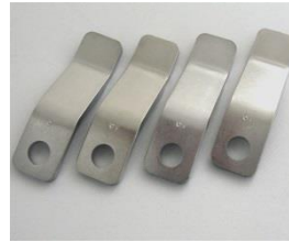
Pasivación transparente de PROSEAL XZ 500