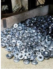
Un abrillantador especial resulta especialmente favorable en el interior de piezas huecas