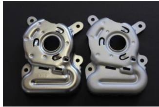
Diferentes grados de brillo de OPAL 7000