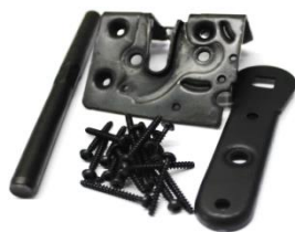
Pasivación negra en diferentes componentes

Otro elemento de la serie PROSEAL es CF 500. Se trata de una pasivación negra para capas zinc-níquel alcalinas y de precipitación ácida. El producto está libre de compuestos de cromato y de cobalto, consiguiendo, incluso sin postratamiento, capas de pasivación uniformes y de color negro profundo. Por medio de un sellado adicional se crean capas brillantes de excelente resistencia a la corrosión.